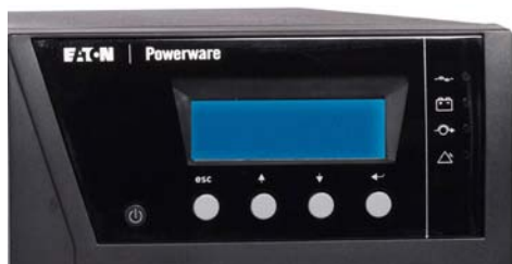
ЖК-дисплей с поддержкой русского языка