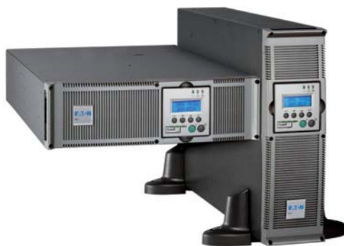
Универсальность Eaton MX