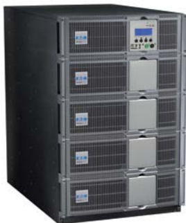
Eaton MX Frame