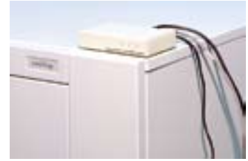
ConnectUPS-E Web/SNMP адаптер (внешний для 9305) Код изделия 103003535-5501