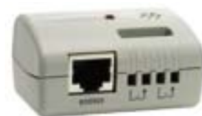
Датчик параметров окружающей среды (EMP) Код изделия 103003637-5501

В интересах совершенствования продукции компания оставляет за собой право изменения параметров спецификации без предварительного уведомления.